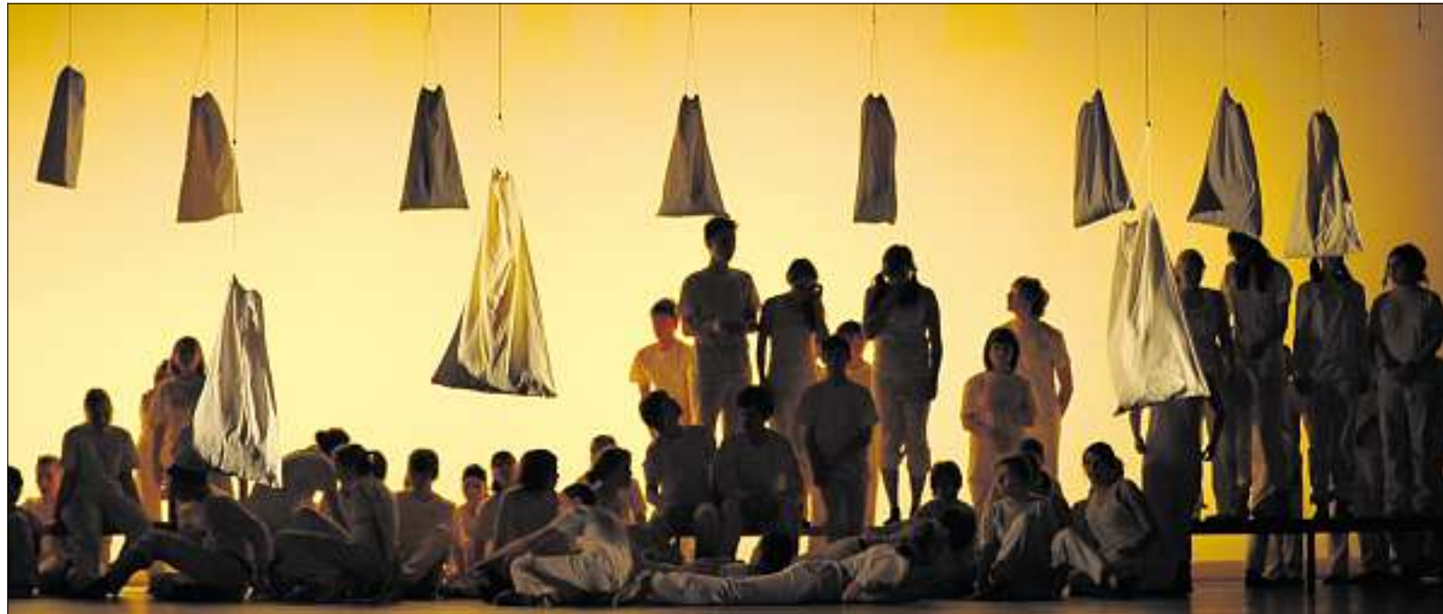
AUFBRUCH: Wie in der Morgendämmerung bewegen sich die „Grenztänzer“ im dritten, letzten Teil der Aufführung – und gehen einen neuen Weg.