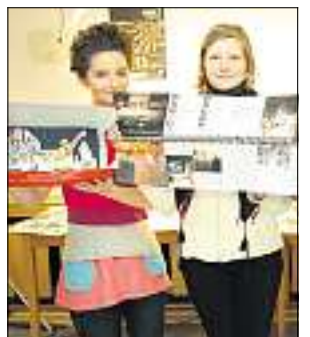
PRODUKTE: Die DokuMedianer haben viel geschaffen in sieben Wochen.

WEIMAR (mh). Sie haben das Programmheft der „Grenztänzer“ so gestaltet, dass die Profis vom DNT „ganz begeistert“ waren. Sie entwarfen „Grenztänzer“-T-Shirts. Und sie haben noch viel mehr gemacht: die Schüler der DokuMedia-Gruppe, die von Medienstudenten der Bauhaus-Uni in die unendlichen Weiten visueller und akustischer Möglichkeiten entführt wurden.