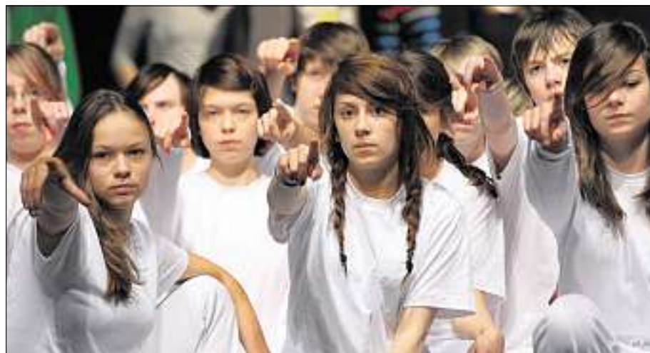
FINGERZEIG: Stumm sprechen die Schüler ihr Publikum am Ende des Abends an.

WEIMAR. Leger schlurften sie auf die Bühne, setzen oder hocken sich hin, bilden ein in sich zusammengesunkenes Halbrund. Doch ersten kräftigen e-Moll-Akkorden aus dem Orchestergraben hebt einer nach dem anderen den Blick und richtet ihn in die Welt. Allmählich gehen sie los, mit ausgestrecktem Arm und Zeigefinger; 101 junge Menschen auf 101 Wegen. Sie treffen ihre erste Richtungsentscheidung. Von nun an gibt es kein zurück. Da ist bald eine Stelle, da